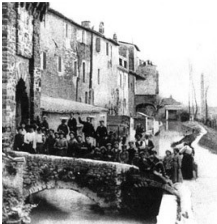
Molino Petrini sul fiume Chiascio, 1822. (www.petrini.com/index.php/la-storia).

Lunedì 5 marzo ad Assisi, presso l'Istituto Serafico, si terrà un importante incontro dal titolo: Diritto e dignità delle Lavoranti dal 1822 .